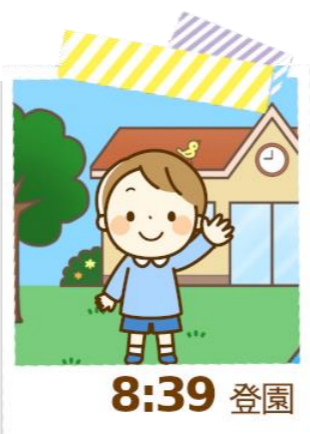
【登園時の写真記録イメージ】

保護者はメールで通知を受け取ることで、毎日の登降園状況を リアルタイムで確認できるので、安心につながります。